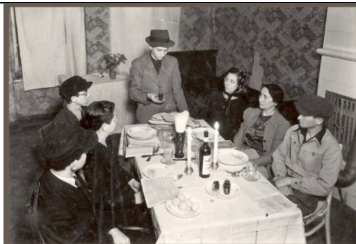
Warsaw, Poland. A man reciting a blessing over a cup of wine at a Passover Seder in the ghetto. A shelter for refugees at 8 Leszno Street, the Osternhilfswerk relief committee. FA3311991